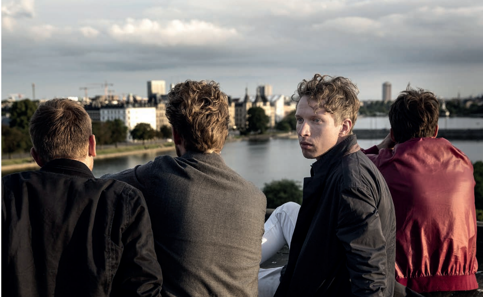
Κυλά στο αίμα του Ράσμου Χέιστερπεργκ