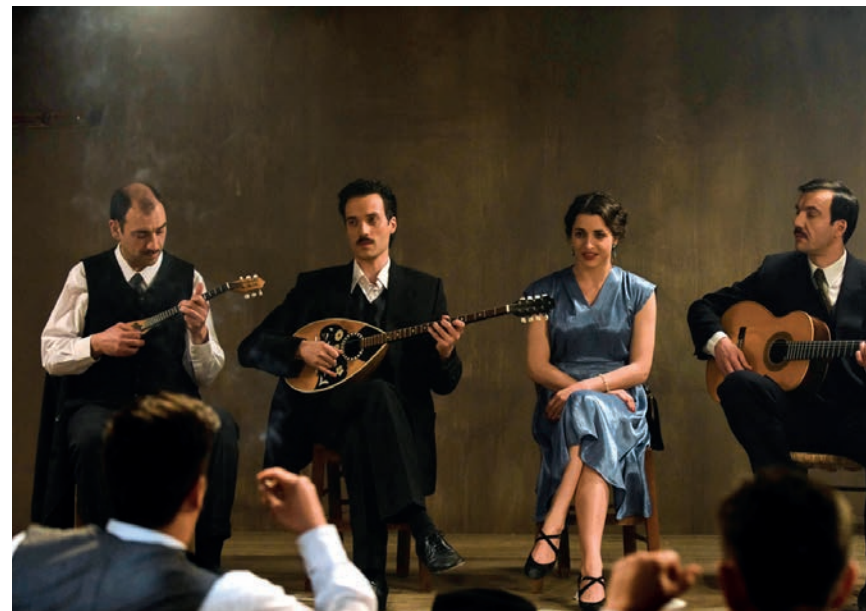
Χαρακτηριστική σκηνή από το Ουζερί Τσιτσάνης του Μ. Μανουσάκη

Ένας απαγορευμένος έρωτας. Η Εβραία και ο Χριστιανός με φόντο τη Θεσσαλονίκη της γερμανικής κατοχής. Οι ιστορίες επαναλαμβάνονται και μας θυμίζουν ότι για τα θέματα της καρδιάς οι άνθρωποι κινούν γη και ουρανό. Γι αυτά πρώτα, κι ύστερα για όλα τα άλλα.