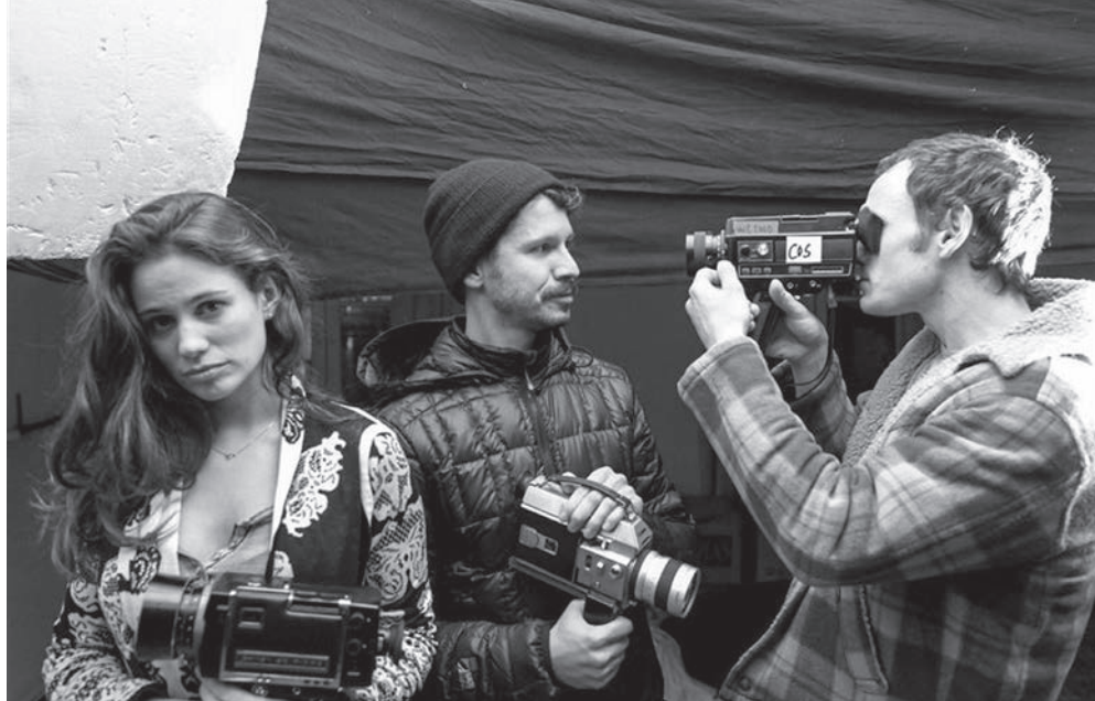
Με το σκουφάκι ο σκηνοθέτης Γκέιμπ Κλίνγκερ στα γυρίσματα του Porto