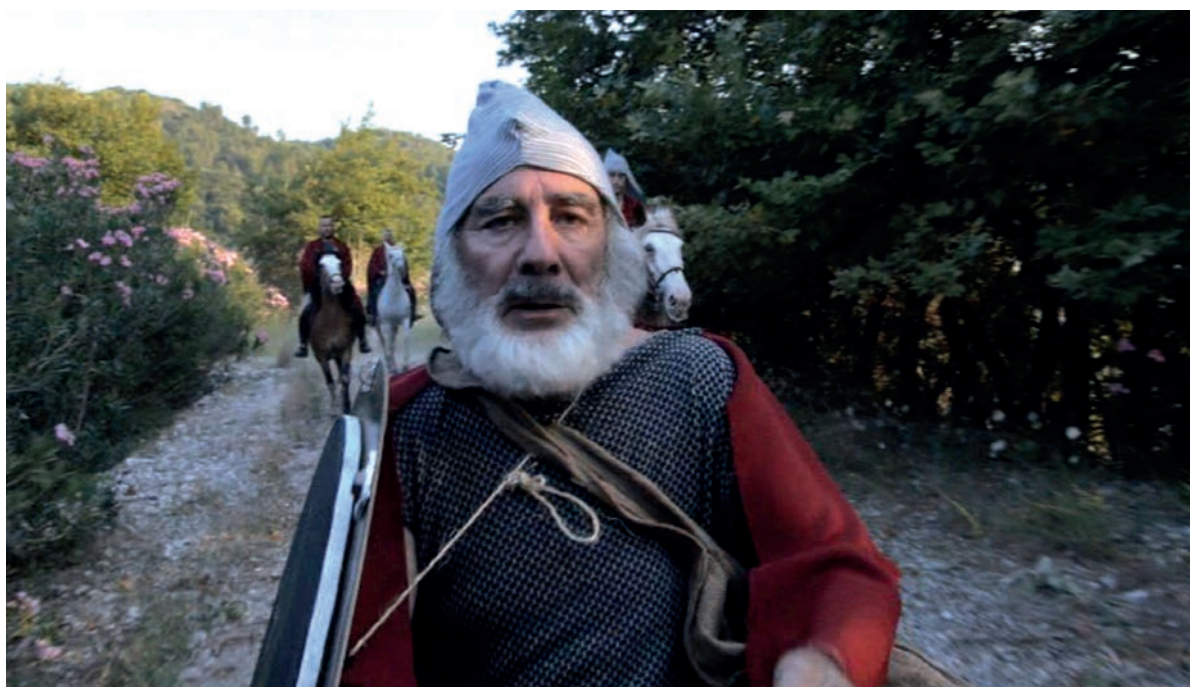
Αλκιβιάδης ο ατίθασος μαθητής του Σωκράτη του Δημήτρη Μακρή