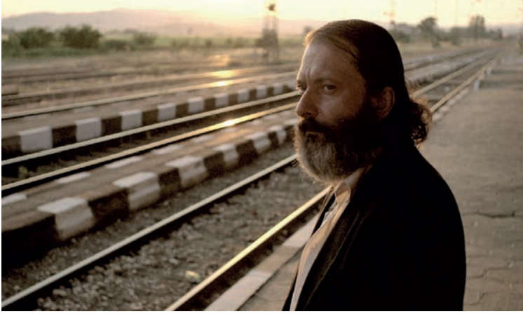
Δόξα, η νέα ταινία του διδύμου Βαλτσάνοφ-Γκρόζεβα