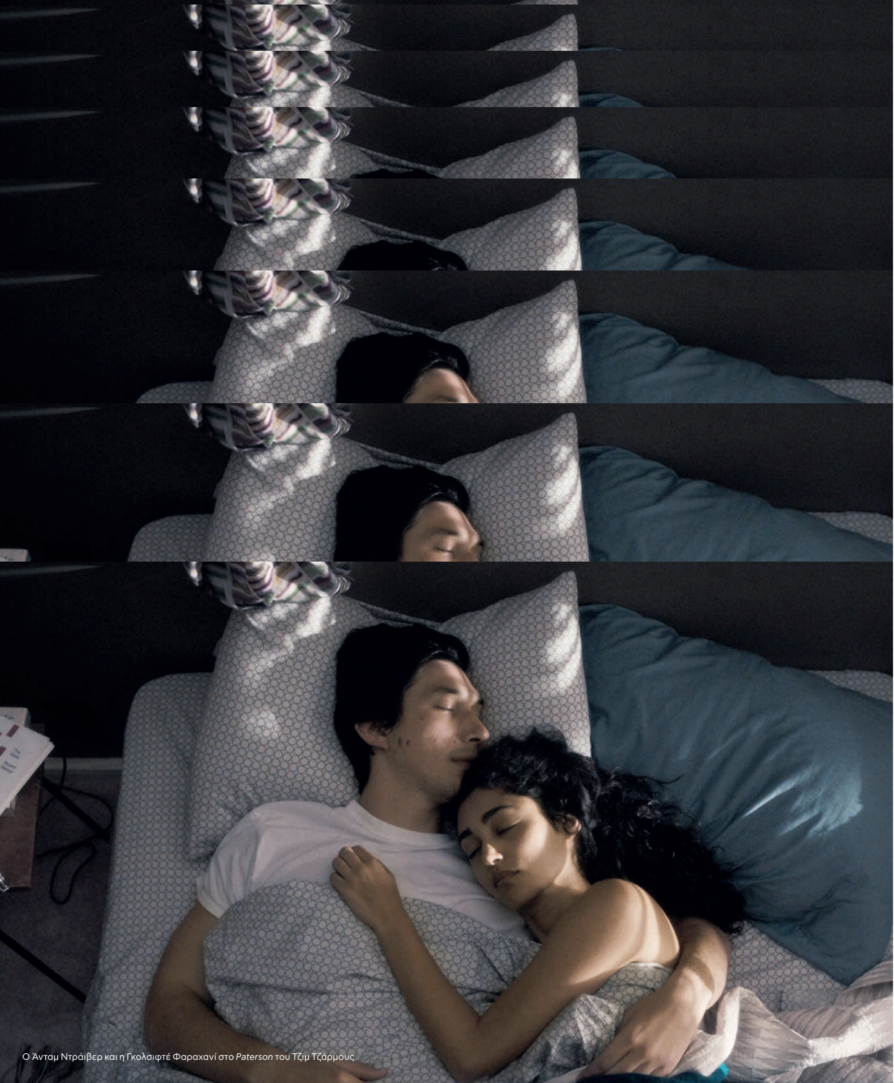
Ο Άνταμ Ντράιβερ και η Γκολσιφέ Φαραχανί στο Paterson του Τζιμ Τζάρμους