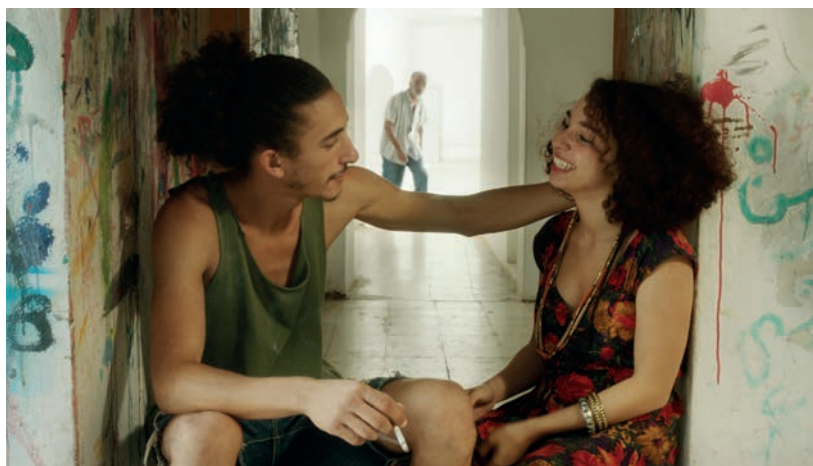
As I Open My Eyes της Λέιλα Μπουζίντ

Τα LUX Film Days σας δίνουν την δυνατότητα να δείτε και τις τρεις ταινίες πριν την βράβευση της μίας από αυτές στο Ευρωπαϊκό Κοινοβούλιο στις 23 Νοεμβρίου, και να συμμετάσχετε κι εσείς με την ψήφο σας στο βραβείο του Κοινού. Ραντεβού στις αίθουσες λοιπόν με την κινηματογραφική Ευρώπη.