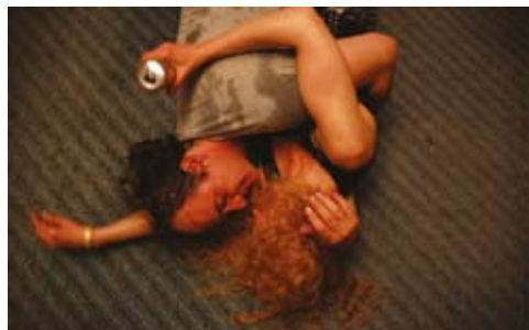
Άσπρος, άσπρος κόσμος/ Belı, belı svet του Oleg Novkovik

[...] Η ταινία ανοίγει μ' ένα μήνυμα του Attaturk, αν και η πολιτική δεν παίζει μεγάλο ρόλο σ' αυτήν. Η αστική τάξη της πόλης αυτοπροβαλλόταν με χοροεσπερίδες στα πιο σημαντικά μέρη. Ένας από τους σπουδαίους χορούς που δόθηκαν, όμως, ήταν ο «Χορός της Δημοκρατίας». Ο Attaturk, για να επιβιώσει πολιτικά την εποχή εκείνη, έστειλε πολλά τηλεγραφήματα στην πόλη. Αυτά τα τηλεγραφήματα διαβάζονταν κατά την διάρκεια του χορού. Για να ξεκινήσω να γράφω τη μοίρα των χαρακτήρων της ιστορίας, εμπνεύστηκα από έναν τέτοιο χορό.