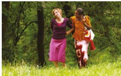
Η ξένη μας/Notre étrangère της Sarah Bouyain

- Αποφάσισα να κάνω μια ταινία για την Αφρική που να παρουσιάζει τη χώρα μέσα από τα μάτια των Ευρωπαίων, γιατί μερικές φορές έχω την αίσθηση ότι όταν οι άνθρωποι λένε Αφρική ονομάζουν ένα μέρος που δεν ανήκει στην πραγματικότητα. Το όραμά μου για την Αφρική προήλθε από την προσωπική μου εμπειρία. Έχω γεννηθεί από γαλλίδα λευκή μητέρα και μαύρο πατέρα από την Μπουρκίνα Φάσο και όλοι ζούσαμε στη Γαλλία. Ο πατέρας μου ήταν πολύ δεμένος με τη χώρα του και πολλές φορές πηγαίναμε εκεί όλοι μαζί. - Ο τίτλος της ταινίας αναφέρεται σε εκείνο