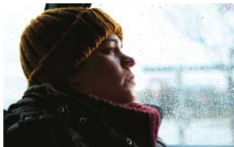
Μητέρα της ασφάλτου/ Majka asfalta του Dalibor Matanic

[...] Είναι πολύ ενδιαφέρον ότι φέτος γυρίστηκε και μια ακόμη σερβική ταινία με θέμα την πόλη Μπορ και τους ανθρώπους της (σ.σ.: το Τίλβα Ρορ του Nicola Lezaic). Είναι πολύ καλή ταινία. Ο σκηνοθέτης είναι γέννημα-θρέμμα της πόλης και η ιστορία του είναι πολύ διαφορετική από τη δική μου. Εκείνος γύρισε ένα φιλμ ενηλικίωσης.