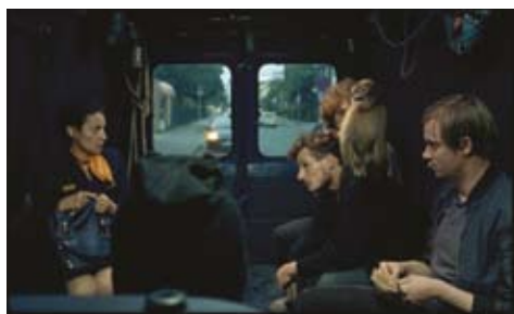
Στην ηλικία της Έλεν/Im alter von Ellen της Pia Marais

το μέρος όπου υπάρχουν άνθρωποι όλων των εθνοτήτων, χωρίς να γνωρίζουν που ανήκουν. Ψάχνουν να βρουν ποιο σημείο της γης είναι το σπίτι τους. Βέβαια, σίγουρα αυτό το μέρος μπορεί να είναι και εκείνο το σημείο που χωρίζει στην ταινία την μητέρα από την κόρη. Ακόμη και να βρεθούν οι δυο τους, δεν ξέρω αν θα μπορέσουν να ενωθούν γιατί μετά από τόσα χρόνια αποχωρισμού, υπάρχει πολλή σιωπή ανάμεσα τους. - Το φιλμ ερευνά το ερώτημα του να νιώθει κανείς ξένος. Η Amy δεν μπορεί να ενωθεί με κανέναν, δεν γνωρίζει την αφρικάνικη γλώσσα, δεν φοράει τα σωστά ρούχα... Κάτι ανάλογο συμβαίνει και στη μητέρα της Mariam, στην Ευρώπη. Έρχεται η στιγμή που γίνονται ξένες μέχρι και στον ίδιο τους τον εαυτό.