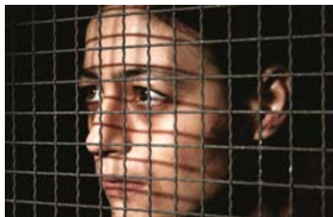
Φθόνος/Kiskanmak του Zeki Demirkubuz

[...] Ο Φθόνος είναι μια ταινία για την ασχήμια σώματος και ψυχής. Ο κεντρικός ήρωας είναι άσχημος στο παρουσιαστικό και για το λόγο αυτό, από ντροπή, παρέμεινε στο σπίτι με μια γυναίκα. Όσον αφορά την προσωπικότητά του, ως ένα βαθμό και από ντροπή και για την όψη του, νιώθει ξένος.