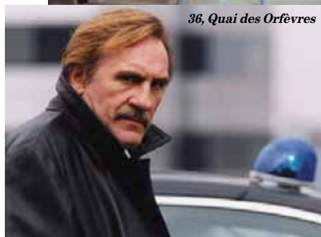
36, Quai des Orfèvres