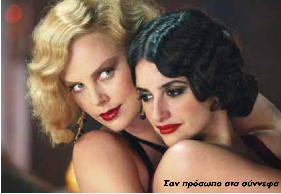
Σαν πρόσωπο στα σύννεφα