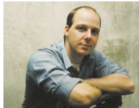
Ατελείωτη θλίψη, η ζωή μετά τη θανατική καταδίκη/ Everlasting sorrow, life after death sentence του David André

- Μετά την πρεμιέρα του φιλμ στο Σάβαντς, κόσμος από το κοινό σηκώθηκε, ήρθε και με συνάντησε κι άρχισε να δωρίζει στο Ίδρυμα χρήματα. Μέσα στις δέκα ημέρες του φεστιβάλ συγκεντρώθηκαν 90.000 δολάρια! Ως αυτή τη στιγμή, το ποσό από δωρεές θεατών έχει ανέλθει στα 750.000 δολάρια! Έτσι το Ίδρυμα του Κρις Μμπούρου προσφέρει πια υποτροφίες σε εθνικό επίπεδο στην Κένυα, ενώ καλύπτει και την ιατρική ασφάλιση των παιδιών. - Έχω κάνει πολύ διαφορετικές μεταξύ τους ταινίες. Αλλά αυτό που τις ενώνει είναι ένα: ότι είναι ωραίες ιστορίες!