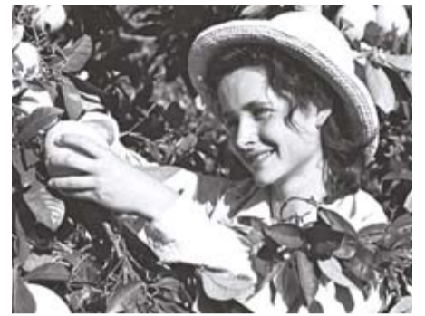
Τζάφα, ο μηχανισμός του πορτοκαλιού/ Jaffa, the orange's clockwork του Eyal Sivan

- Στη Θεσσαλονίκη κάνουμε την παγκόσμια πρεμιέρα μας. Όμως, αν και η ταινία δεν έχει προβληθεί πουθενά, περιοδικά όπως το Nouvel Observateur , το Le Monde Magazine , το Telerama , το Nova κ.α. έχουν ήδη ασχοληθεί μαζί της ανακοινωνώντας την προβολή της. Επίσης, η Le Monde , η La Stampa , η El Pais –και τον επόμενο μήνα το Timesonline – έχουν δημοσιεύσει πορτρέτα που έγραφα με περιγραφές των αξιωματικών της φυλακής που εκτέλεσαν τους κρατούμενους. Πιστεύω ότι η ταινία πρέπει να ιδωθεί κυρίως ως μια προσωπική εμπειρία παρά ως μια καταγγελία της θανατικής ποινής.