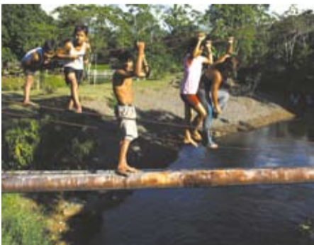
Ένα μέλλον χωρίς πετρέλαιο/ A future without oil της Laëtitia Moreau

- Το «Φθινοπωρινό χρυσάφι» είναι το πρώτο μου ντοκιμαντέρ και εξεπλάγην από την επιτυχία που σημείωσε. Νομίζω ότι η επιτυχία οφείλεται στο οικουμενικό του θέμα. Γενικά μιλώντας, το θέμα της ταινίας είναι η ζωή η ίδια, και το πώς αυτοί οι αθλητές τη ζουν στον απόλυτο βαθμό, έστω κι αν διανύουν τα τελευταία μέτρα πριν τον τερματισμό. Το ερώτημα πώς θα γεράσουμε διατηρώντας την αξιοπρέπεια, τη φιλοδοξία και το πάθος μας, μας απασχολεί όλους. - Πραγματικά δεν μπορώ να πω ποιος από τους πέντε χαρακτήρες της ταινίας μου αρέσει περισσότερο. Είναι όλοι τους πολύ ξεχωριστοί, και γι' αυτό τους διάλεξα. Ο Χέρμπερτ, ο Σουηδός δρομέας, έχει μια απίστευτη αίσθηση του χιούμορ, ο Γίρι, ο Τσέχος άλτης, είναι φιλόδοξος μα ταυτόχρονα ευαίσθητος, η Γκέμπερ, η Ιταλίδα δισκοβόλος μάς δείχνει πώς να γερνάμε με χάρη και ούτω καθεξής. Ο καθένας τους έχει χαρακτηριστικά που θαυμάζω. [...] Είμαι εξαιρετικά προνομιούχος, διότι έχω τη δυνατότητα να κάνω ταινίες πάνω σε πολύ διαφορετικά θέματα –από σπαρ του Λας Βέγκας μέχρι ρακοσυλλέκτες ή, εν προκειμένω, υπερήλικες δρομείς. Πίσω απ' όλα κρύβεται η περιέργειά μου για την ανθρώπινη φύση, την πολυπλοκότητα και την εκπληκτική ποικιλομορφία της.