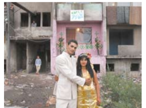
Ξενοδοχείο «Ο Παράδεισος»/ Paradise Hotel της Σοφία Τζαβέλλα

- Ο εξαιρετικός Ισραηλινός ερευνητής -καθηγητής Raz-Krakotzkin διατυπώνει στην ταινία την άποψη ότι πρέπει η έννοια του Ισραηλινού έθνους να επανεφεύρει τον εαυτό της περιλαμβάνοντας και την Παλαιστινιακή ταυτότητα. Αυτός ο εκ νέου ορισμός της εβραϊκής ταυτότητας είναι προϋπόθεση για ένα κοινό μέλλον. Αναφέρομαι στη διαδικασία της αποαποικιοποίησης του αποικιοκράτη, ήτοι της αποαποικιοποίησης της εβραϊκής ταυτότητας.