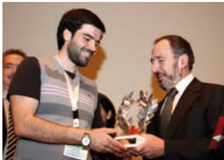
ΑΝΔΡΕΑΣ ΜΑΡΤΙΝΗΣ, ΠΡΟΕΔΡΟΣ ΤΟΥ ΕΛΛΗΝΙΚΟΥ ΕΡΥΘΡΟΥ ΣΤΑΥΡΟΥ

Οι πρόεδροι δύο σημαντικών φορέων που στηρίζουν έμπρακτα και σταθερά το Φεστιβάλ Ντοκιμαντέρ Θεσσαλονίκης αλλά και το ντοκιμαντέρ ως κινηματογραφικό είδος γράφουν στο «Πρώτο Πλάνο».