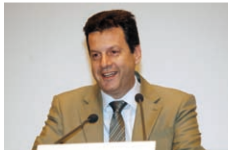
ΧΡΗΣΤΟΣ ΠΑΝΑΓΟΠΟΥΛΟΣ, ΠΡΟΕΔΡΟΣ ΤΗΣ ΕΡΤ Α.Ε.

και σε ειρήνη. Σήμερα όμως η ειρήνη δεν είναι γεγονός, λόγω των μεγάλων προβλημάτων που αντιμετωπίζει ο σύγχρονος άνθρωπος σε ένα αφιλόξενο περιβάλλον, σε μια κοινωνία που αδυνατίζει ο ιστός της και που αντί να καρπώνεται τα επιτεύγματα της τεχνολογίας υφίσταται κοινωνική, οικονομική και πάσης φύσεως αδικία. Το καταστατικό μας συνεχώς εκσυγχρονίζεται ώστε να αντιμετωπίζει τους σύγχρονους πολέμους που είναι η φτώχεια, ο ρατσισμός και η δυστυχία».